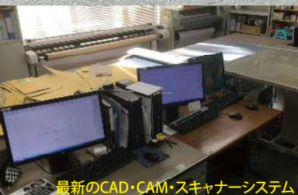
最新のCAD・CAM・スキャナーシステム