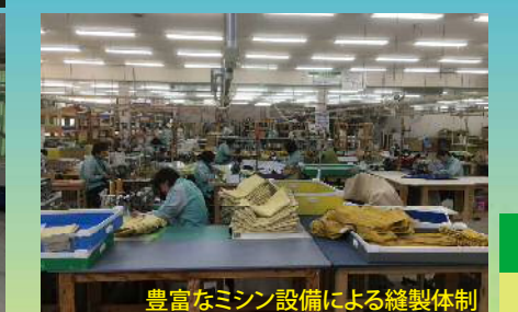
豊富なマシン設備による縫製体制