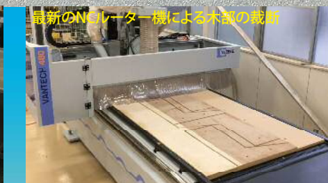
最新のNCルーター機による木部の裁断